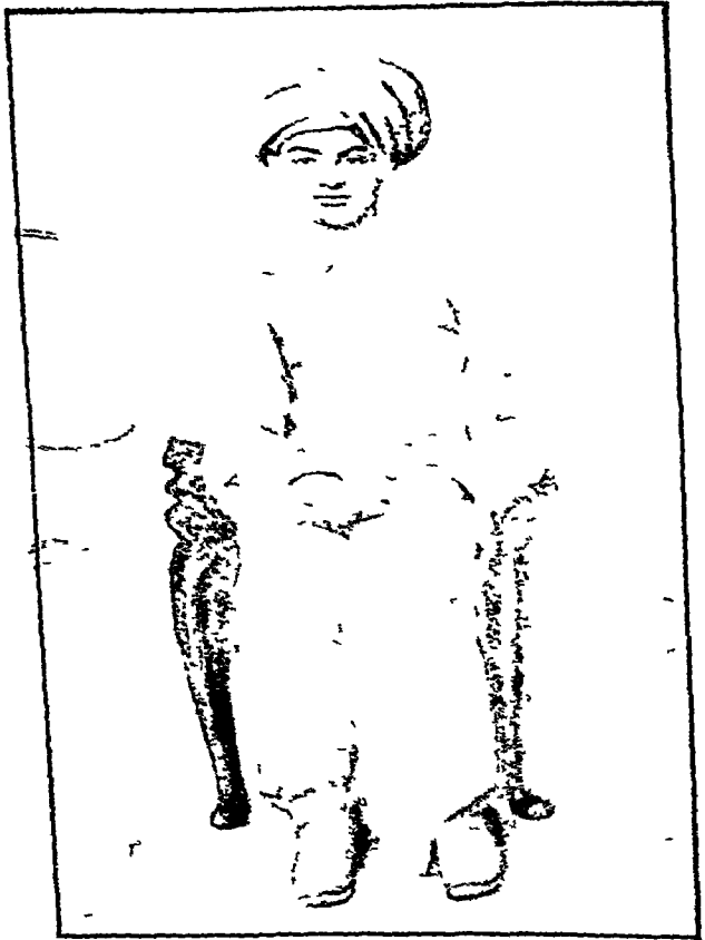
श्रीमद् राजचन्द्र ( १६वाँ वर्ष )